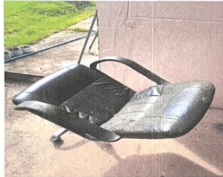
(๑๔). เก้าอี้สำนักงาน ขนาด ๕๗๕*๕๖๐*๙๑๐ มม.