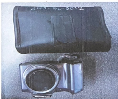
(๔). กล้องถ่ายรูป OL YMPUS รหัสครุภัณฑ์ ๔๕๒-๕๖-๐๐๑๒ วันที่ได้มา ๒๖ ก.ย.๕๖ จำนวนเงิน ๑๕,๐๐๐ บาท