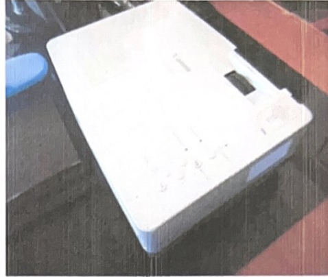
(๑๓). เครื่องโปรเจคเตอร์