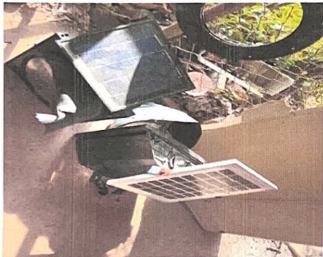
(๘). ไฟกระพริบพลังงานแสงอาทิตย์ รหัสครุภัณฑ์ ๔๕๓-๕๓-๐๐๐๓-๔ วันที่ได้มา ๖ ส.ค.๕๓ จำนวนเงิน ๕๖,๐๐๐ บาท