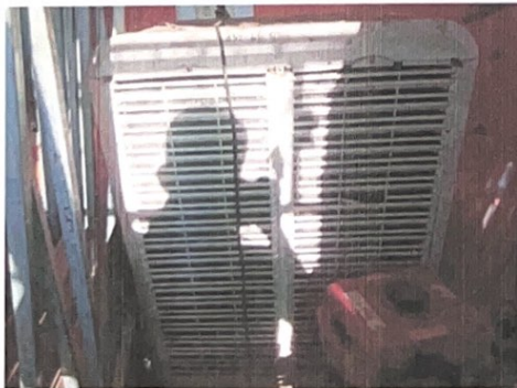
(๑๐). พัดลมไอเย็น รหัสครุภัณฑ์ ๔๓๒-๖๐-๐๑๐๖ วันที่ได้มา ๒๘ ส.ค.๖๐ จำนวนเงิน ๒๔,๐๐๐ บาท