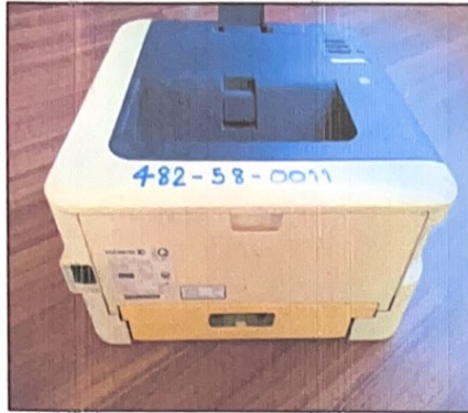
(๑).เครื่องพิมพ์ ขาวดำ Fuji Xerox รุ่นp๒๖๕dw รหัสครุภัณฑ์ ๔๘๒-๕๘-๐๐๑๑ วันที่ได้มา ๒๙ ก.ย.๖๐ จำนวนเงิน ๕,๕๐๐ บาท