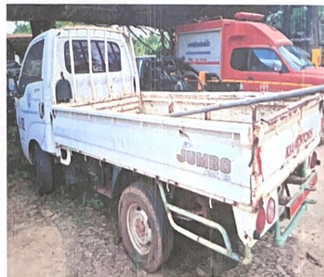
(๕).รถยนต์บรรทุกอเนกประสงค์ รหัสครุภัณฑ์ ๐๐๑-๔๘-๐๐๐๓ วันที่ได้มา ๑๖ พ.ค.๔๘ จำนวนเงิน ๖๓๐,๐๐๐ บาท