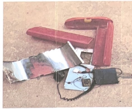
(๗). สัญญาณไฟฉุกเฉิน รหัสครุภัณฑ์ ๔๕๓-๕๓-๐๐๐๒ วันที่ได้มา ๖ ส.ค.๕๓ จำนวน ๖๓๐,๐๐๐ บาท