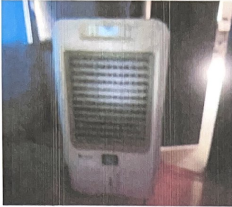
(๑๒).พัดลมไอเย็น