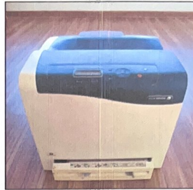
(๒).เครื่องพิมพ์เลเซอร์ชนิด LED สี Fuji Xerox รุ่น CPm๐๕D รหัสครุภัณฑ์ ๔๘๒-๖๐-๐๐๒๐ วันที่ได้มา ๒๑ ก.พ. ๖๐ จำนวนเงิน ๑๒,๐๐๐ บาท