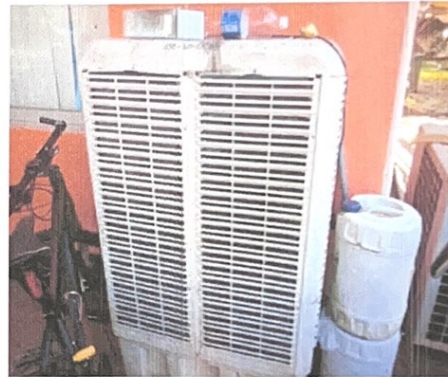
(๙). พัดลมไอเย็น รหัสครุภัณฑ์ ๔๓๒-๖๐-๐๑๐๕ วันที่ได้มา ๒๘ ส.ค.๖๐ จำนวนเงิน ๒๔,๐๐๐ บาท