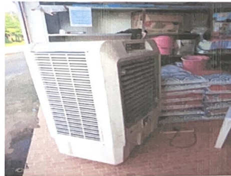
(๑๑). พัดลมไอเย็น รหัสครุภัณฑ์ ๔๓๒-๖๐-๐๑๐๗ วันที่ได้มา ๒๘ ส.ค.๖๐ จำนวนเงิน ๒๔,๐๐๐ บาท